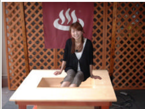
遠赤外線効果で体の芯まで ほっかほか〜〜?

施設や店舗用に導入したいが、足湯設備は高価で煩雑で管理が面倒とお考えの貴殿に 特に朗報!! 個人用 業務用大型槽を問わず、低コストで導入できます。 省スペースで大掛かりな設備は必要ありません、電源さえあれば足湯温泉気分が実現いたします。 (お湯をいしませんのでボイラー・浄化給湯設備 配管などの付帯設備も不要) お湯替えの必要が無く衛生管理・メンテナンスは大変簡単です。 セラミックボールは、 銀イオン・銅イオン抗菌効果原料 を添加して焼結させた 抗菌仕様 です。衛生管理も安心して行えます。 靴下やストッキングを脱ぐ必要がありません、チョットしたお時間で足湯に入れるとして、 好評をいただいております。 特に、多少お待ちいただく時間が発生する店舗施設でも、不機嫌なくお待ちいただけます。 また、店舗への滞留時間も長くなり、お寛ぎいただく事により、売上げUPに貢献いたします。 クチコミや宣伝で施設・店舗へ、お客様の誘導効果や他店との差別化には効果絶大!!